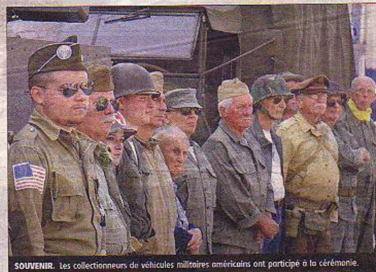
SOUVENIR. Les collectionneurs de véhicules militaires américains ont participé à la cérémonie.