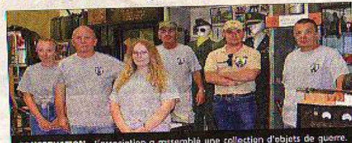
CONSERVATION. L'association a rassemblé une collection d'objets de guerre.

Les souvenirs des familles. Parmi les dons faits par les familles reconnaissantes du travail fait l'AFCVM, l'uniforme de Sam Isaacs et peut-être le plus précieux ou du moins le plus émouvant. Le Lieutenant Isaacs est l'un des libérateurs de Dreux. Il commandait la colonne attaquée par les Allemands à la Fouchère à Vermonville le 16 août 1944. Sept soldats ont trouvé la mort dans l'embuscade.