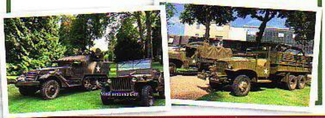
8 - Vehicules Militaires Magazine

Static Show et convois mémoriels à travers la ville en présence des autorités, l'AFCVM rencontra un franc succès avec ses véhicules. Retrouvez l'AFCVM sur son site internet ( www.afcvm.com ) ou sur sa page Facebook (AFCVM).